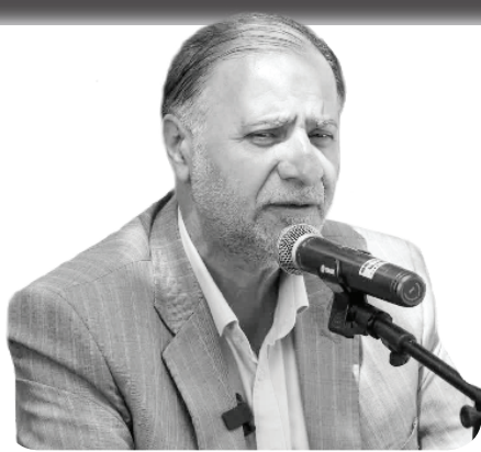
رئیس کمیسیون سلامت و محیط زیست شورا خبر داد: تعریف ۱۵ پروژه شاخص با هدف افزایش و ارتقای خدمات شهرداری

ناظر شورا در سازمان سیما منظر و فضای سبز شهری در بخش دیگری از سخنانش بیان داشت: موضوع اقتصادی کردن باغات عمومی و بوستان‌ها در شهرداری شیراز سیاست‌گذاری شده و این زمینه است تا با جذب سرمایه‌گذار مقدمات فعال‌سازی آنها را فراهم آورد.