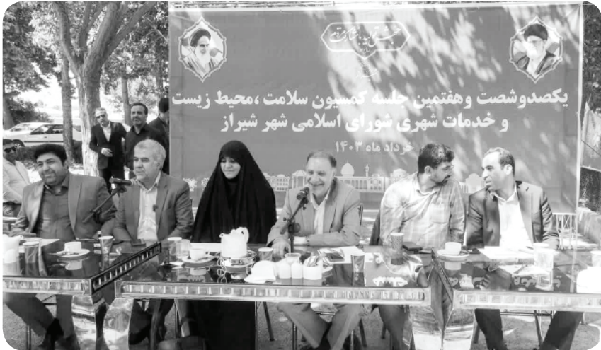
یکصد و هفتمین جلسه کمیسیون سلامت، محیط زیست و خدمات شهری شورای اسلامی شهر شیراز

رئیس سازمان سیما، منظر و فضای سبز شهری شهرداری شیراز در سال گذشته طرحی را جهت راه‌اندازی این مرکز تهیه و به سازمان سرمایه‌گذاری شهرداری شیراز جهت فراخوان جذب سرمایه‌گذار ارائه نمودیم تا عملیات راه‌اندازی این مرکز با همراهی سرمایه‌گذار سریع‌تر انجام شود.