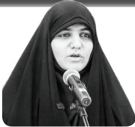
ناظر شورا در سازمان سیما، منظر و فضای سبز شهری عنوان کرد: گستراندن فرش سرخ برای سرمایه‌گذاران حوزه فضای سبز