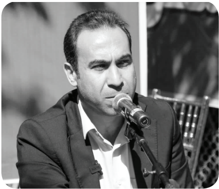
رئیس کمیسیون سلامت، محیط زیست و خدمات شهری شورای ششم در مرکز تحقیق و تولید گل‌و گیاه شمال غرب شیراز (گویم) به عنوان یکی از زیرساخت‌ها برای سرفراری شیراز به عنوان شهر گل و بلبل و تحقق یکی از ۱۵ پروژه شاخص کمیسیون با ظرفیت سرمایه‌گذاری موضوعی است که با محوریت سازمان سیما منظر و فضای سبز شهری شهرداری شیراز دنبال می‌گردد.