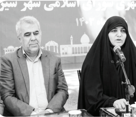
ناظر شورا در سازمان سیما، منظر و فضای سبز شهری عنوان کرد: گستراندن فرش سرخ برای سرمایه‌گذاران حوزه فضای سبز