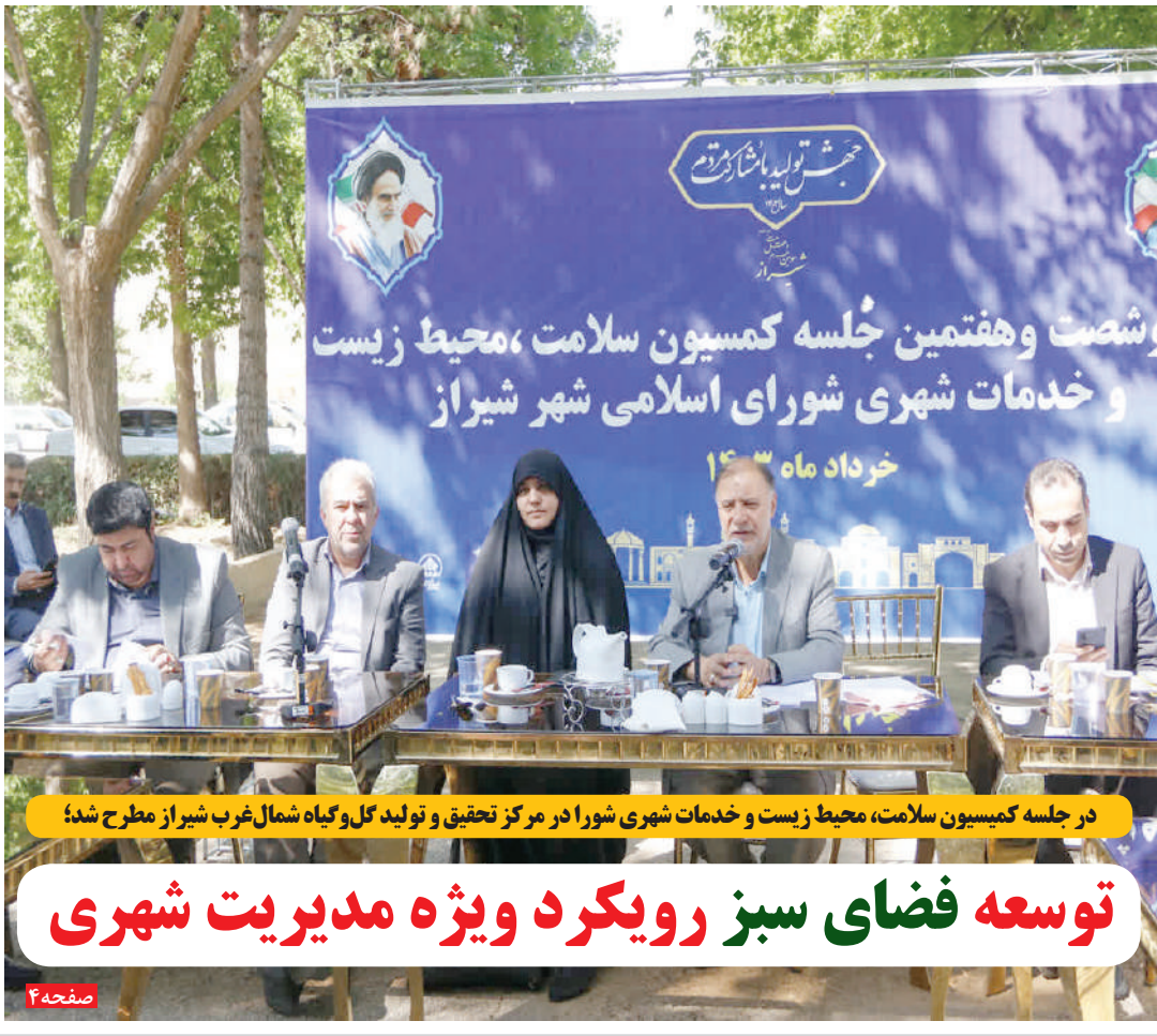
در جلسه کمیسیون سلامت، محیط زیست و خدمات شهری شورا در مرکز تحقیق و تولید گل و گیاه شمال غرب شیراز مطرح شد؛

چون اینقدر نداری کشیدند که به تنها چیزی که می‌توانند جنگ بزنند صفحه گوشی برای کسب ثروت باد آورده است.