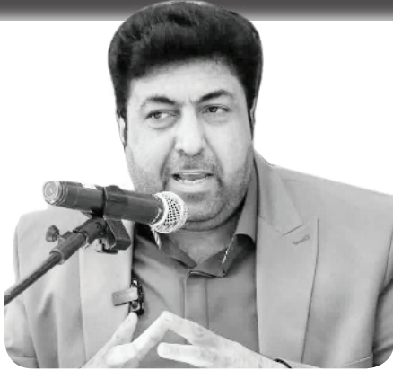
رئیس سازمان سیما، منظر و فضای سبز شهری شهرداری شیراز تصریح کرد: سامانه «بوستان» سازمان را متحول خواهد کرد

بازنگری سیاست‌های جذب سرمایه‌گذار در حوزه فضای سبز