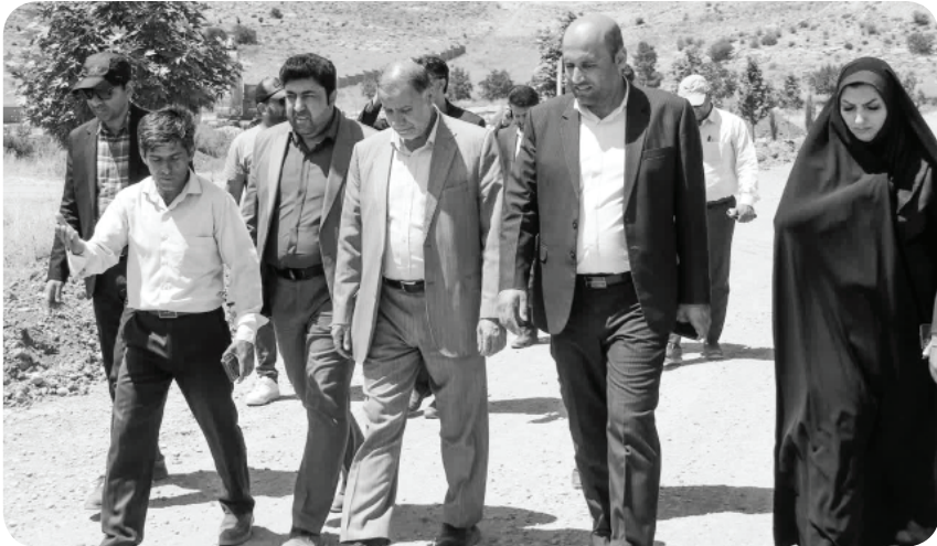
رئیس کمیسیون سلامت، محیط زیست و خدمات شهری شورای ششم در مرکز تحقیق و تولید گل‌و گیاه شمال غرب شیراز (گویم) به عنوان یکی از زیرساخت‌ها برای سرفراری شیراز به عنوان شهر گل و بلبل و تحقق یکی از ۱۵ پروژه شاخص کمیسیون با ظرفیت سرمایه‌گذاری موضوعی است که با محوریت سازمان سیما منظر و فضای سبز شهری شهرداری شیراز دنبال می‌گردد.