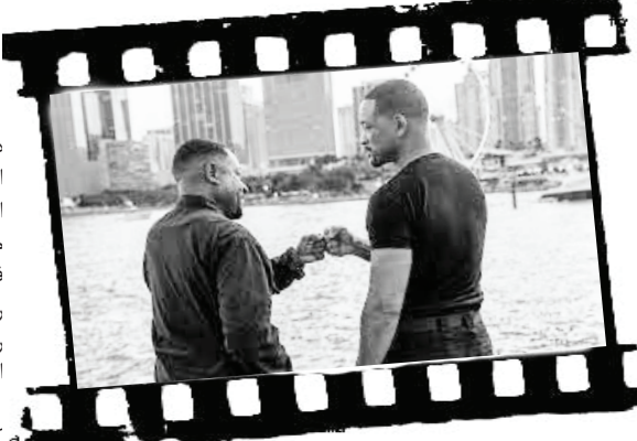
کمدی اکشن «پسران بد: بران یا بامیر» در نخستین هفته اکران خود موفق به ثبت فروش جهانی ۱۰۴ میلیون

فیلم «پسران بد: بران یا بامیر» محصول کمپانی سونی به کارگردانی کارگردانان بلژیکی عادل العربی و بلال فلاح در نخستین هفته اکران خود فراتر از پیش‌بینی‌ها عمل کرد و