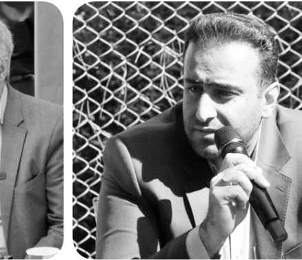
رئیس کمیسیون سلامت، محیط زیست و خدمات شهری شورای ششم در مرکز تحقیق و تولید گل‌و گیاه شمال غرب شیراز (گویم) به عنوان یکی از زیرساخت‌ها برای سرفراری شیراز به عنوان شهر گل و بلبل و تحقق یکی از ۱۵ پروژه شاخص کمیسیون با ظرفیت سرمایه‌گذاری موضوعی است که با محوریت سازمان سیما منظر و فضای سبز شهری شهرداری شیراز دنبال می‌گردد.