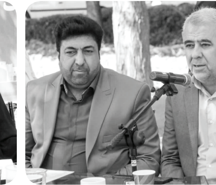
رئیس سازمان سیما، منظر و فضای سبز شهری شهرداری شیراز تصریح کرد: سامانه «بوستان» سازمان را متحول خواهد کرد